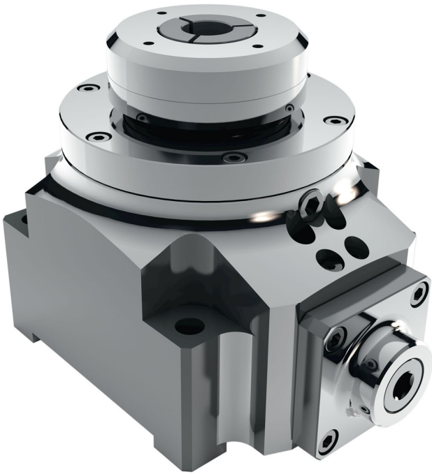
Mechanisches Handspannfutter SK Ausführung SK-2, Werkstückspannung über Druckspannzange